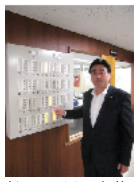
新しい電光掲示板前

後援会活動を拡充するため、年間102千円の会費で会員を募集しています。ご協力のほど宜しくお願い致します。会員の皆様には、イベント情報や年4回の機関誌をお届けいたします。 ご連絡は(090-3516-8344)まで。 編集後記 都議会議員選挙のため、区議会だよりの発行が遅れましたことを、お詫び申し上げます。