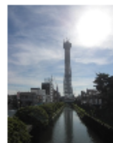
工事中のスカイツリー

国の予算編成に 期待する 7月11日に参議院選挙が終わり、街の中は少し静けさが帰ってきました。 しかし17日の梅雨明けとともに、今度は猛暑が街の中をにぎにぎしく煽っているようにも見受けられます。政治も経済もそして環境もいつになったら落ち着きを取り戻すことができるのか、このことはこれから始まる国の予算編成の過程で答えを見つけられるのではと期待しています。 民主党政権のマニフェストのなかで、よく1丁目1番地の政策は、地域主権改革といわれます。参議院選挙前の6月22日には、地域主権戦略大綱として閣議決定され、明治以来の中央集権体質からの脱却を第一に謳っています。その中に地域主権改革の定義は、「日本国憲法の理念の下に、住民に身近な行政は、地方公共団体が自主的かつ総合的に広く担うようにすることも、地域住民が自らの判断と責任において地域の諸課題に取り組むことができるようにするための改革である。」と書かれています。