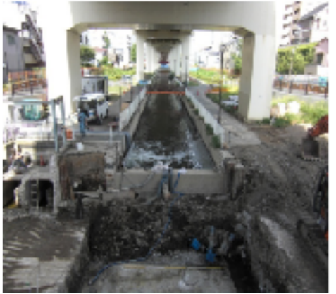
横十間側から見た工事の様子

堅川河川敷公園の改修工事が進んでいます。写真のように横十間川の方から番所橋まで続く工事ですが、今年度は五之橋まで工事を行います。