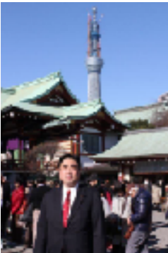
亀戸天神から見るスカイツリー